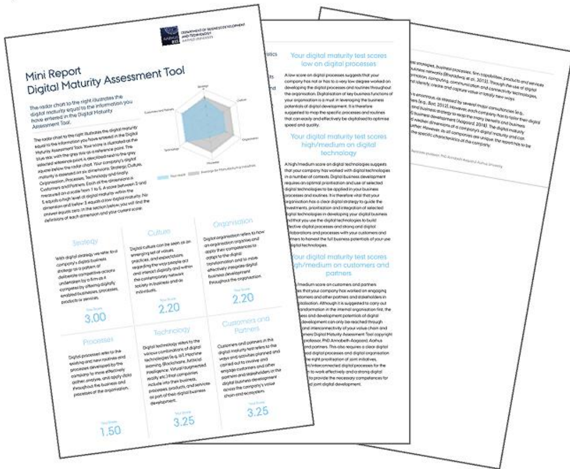
"Digital Maturity Assessment Tool" af Annabeth Agaard (2018)